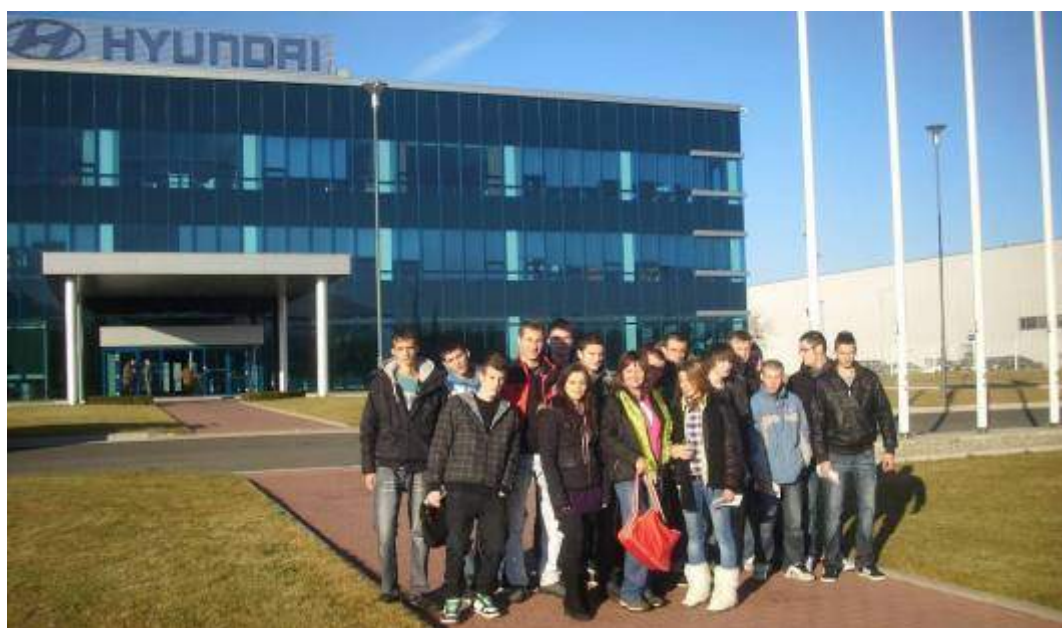
Autori: Mgr. J. Marcinčin, Bc. Vlasta Balíková - majstri OV